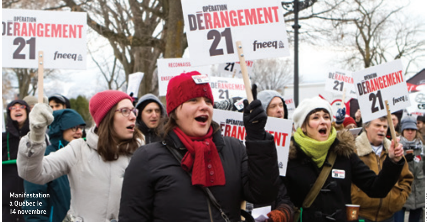
Manifestation à Québec le 14 novembre