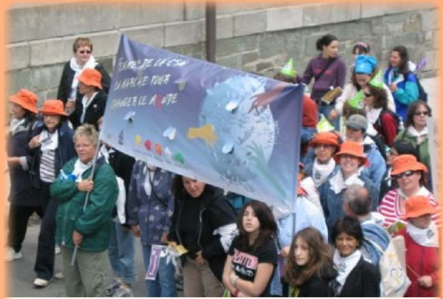
Accueil de la Charte mondiale des femmes pour l'humanité, Québec, 7 mai 2005

► (...) Les luttes que nous menons au quotidien pour préserver l'emploi, pour améliorer le Code du travail et ouvrir la voie à la syndicalisation, pour maintenir et développer les services publics, pour instaurer l'équité salariale, pour mieux conjuguer travail et famille, pour faire reculer les droits de gérance et améliorer les conditions de travail, pour extirper la violence de nos milieux de travail n'ont de sens que si elles s'inscrivent dans un combat plus large qui s'attaque aux valeurs néolibérales et au patriarcat; qui ne laisse pas sur le quai des exclus, des moins égaux que d'autres, des plus dominés et violentés que d'autres 1 . »