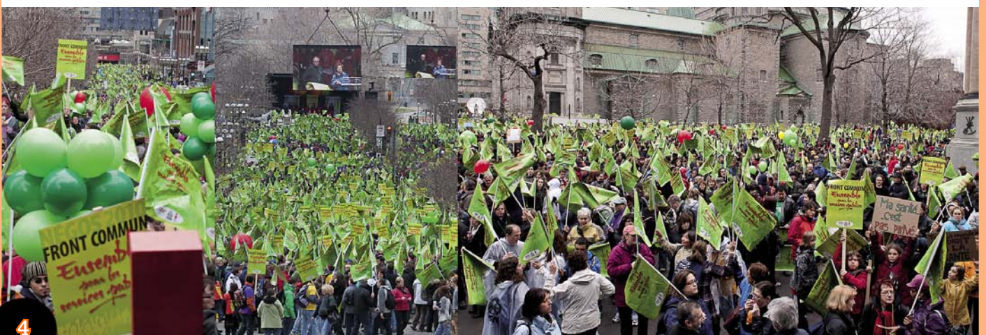
Manifestation du front commun du secteur public, Montréal, 20 mars 2010

Nous combattons donc avec vigueur le type de changements pervers qu'introduit le budget Bachand en recourant au concept d'utilisateur-payeur dans les services de santé au lieu de garantir une accessibilité basée sur les besoins des personnes.